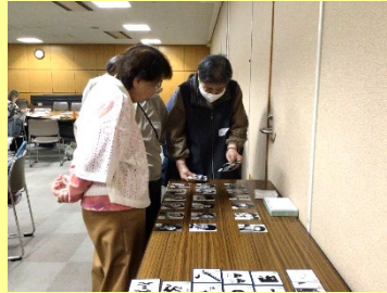
昭和スターカルタ