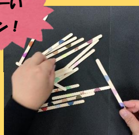
同じ組み合わせを 見つけて