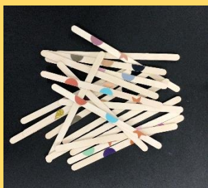
マドラーの山から

バラバラになったマドラーの山から、同じ組み合わせのものを探し、並べます。 ひとりでタイムアタック、チーム戦で早く並べ終わった方が勝ち!など、様々な遊び方で トライしてみてください。