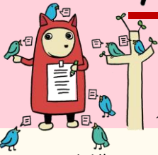
介護サービス相談員キャラクター「クーちゃん」

介護サービス相談員派遣事業は、介護保険制度が始まり介護サービスの利用が措置から契約へ移行したことを受け、利用者の権利擁護とサービスの質的向上を目的に創設されました。 利用者 と 事業者との橋渡し を通して、 苦情に至る前に未然に課題解決 をしたり、 利用者の日常的な不平、不満または疑問 に対応して改善の途を探ることを目的に実施しています。