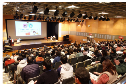
●地域のお宝発表会inまつやま