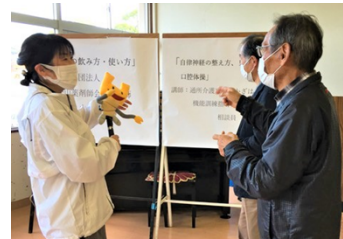
●地区社会福祉協議会の支援