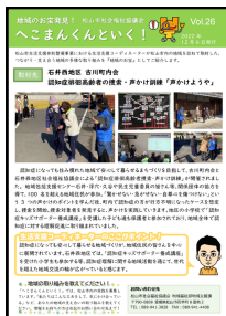
●地域のお宝発見！ へこまんくんといく！