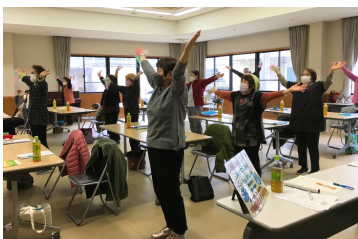
●地域の集いの場の創出