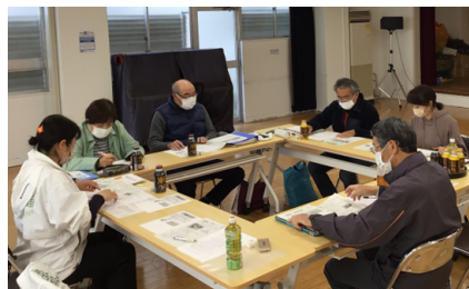
●暮らし支え合う井戸端トーク（協議体）