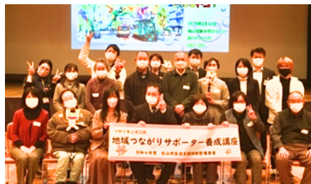
●地域つながりサポーター養成講座