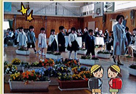
4月 入学おめでとう!