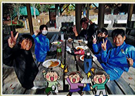
5年生 集団宿泊活動