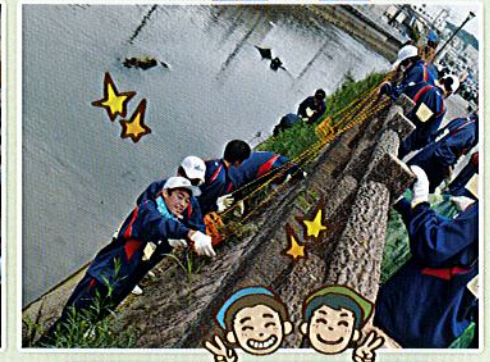
7月 三津浜クリーン活動