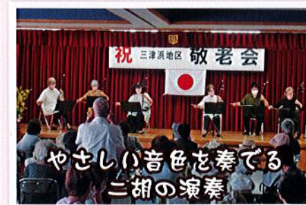
やさしい音色を奏でる二胡の演奏