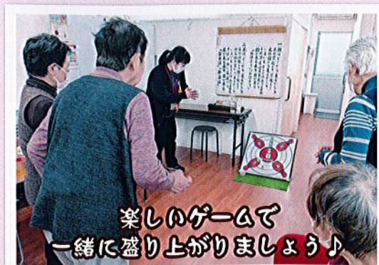
楽しいゲームで一緒に盛り上がりましょう♪

主に始まりの歌を歌ってから、ラジオ体操、手芸、たのしいゲーム、脳トレなどをして、利用者の方々と充実した楽しい時間を過ごしています。