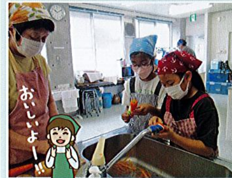
夏休みのカレーづくり