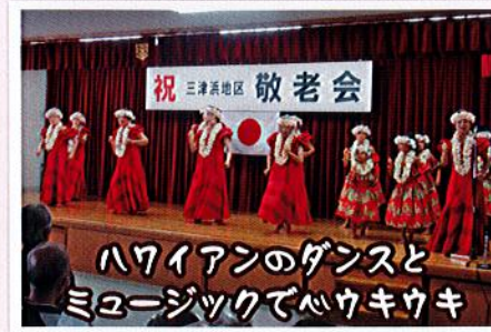
ハワイアのダンスとミュージックでハウキウキ