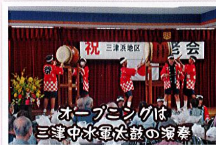
オープニングは三津中水軍太鼓の演奏

令和6年の敬老会にもお元気で参集頂けることを祈念申し上げまして、報告といたします。(三津浜地区敬老会実行委員会)