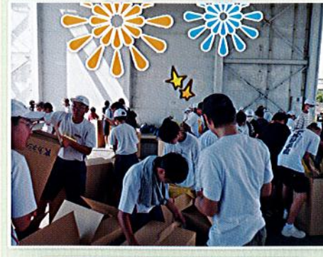
8月 花火大会ボランティア