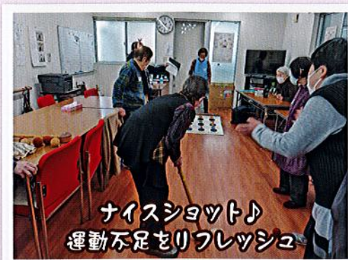
ナイスショット♪ 運動不足をリフレッシュ