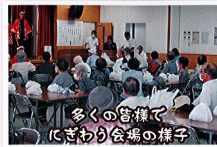
多くの皆様でにぎわり会場の様子