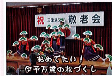
おめでたい!伊予万歳の松づくし