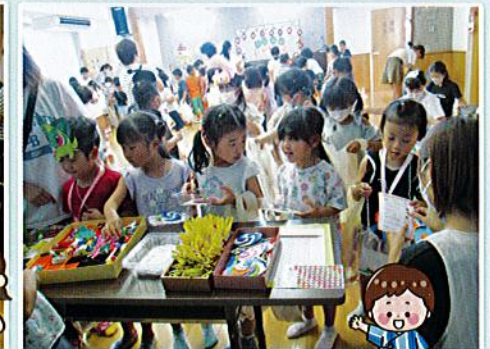
みんなでお店屋さんごっこ