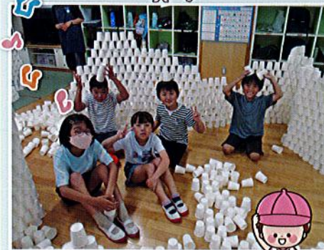
紙コップを使って♪