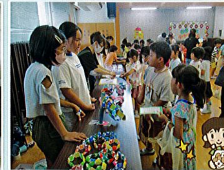
保育園のお友達と交流