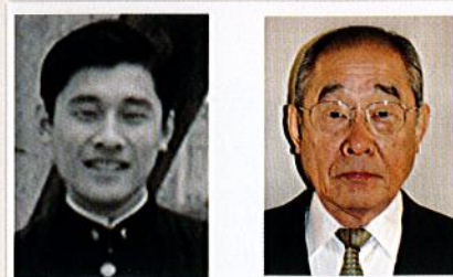
二十歳の頃 → どうなった今

新型コロナウイルス感染症もインフルエンザと同等の扱いとなり、世の中の活動が以前に戻りつつある昨今です。