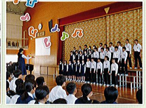
11月 文化祭・合唱コンクール