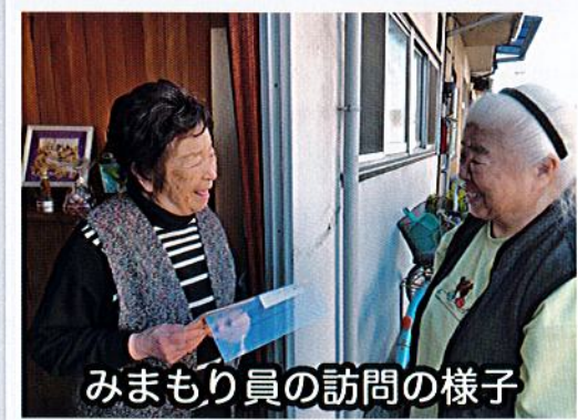
みまもり員の訪問の様子

(地区社協では、活動のモチベーション向上のために兼清福祉基金から助成しています。)