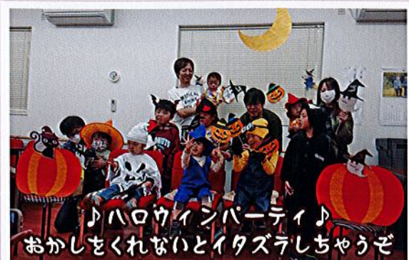
♪ハロウィンパーティ♪ おかしをくれないとイタズラしちゃうぞ

体操、クラフト、けん玉、ぬりえ、脳トレ、カラオケ、おしゃべりなど、くつろぎの時間を楽しんでいます。