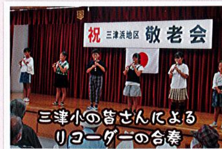
三津小の皆さんによるリコーダーの合奏