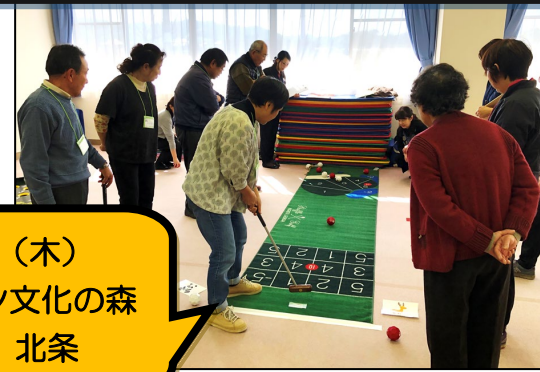
1/17(木) サロン文化の森 in 北条