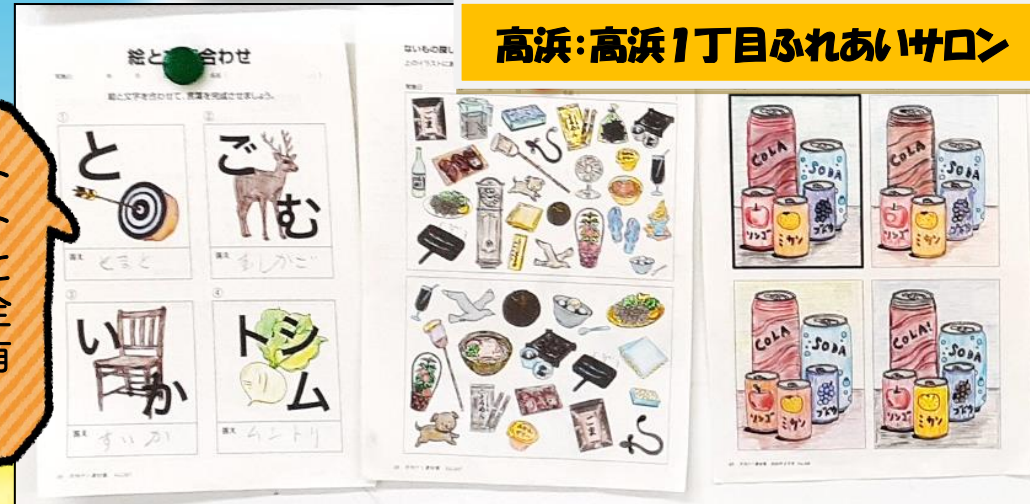
高浜:高浜1丁目ふれあいサロン