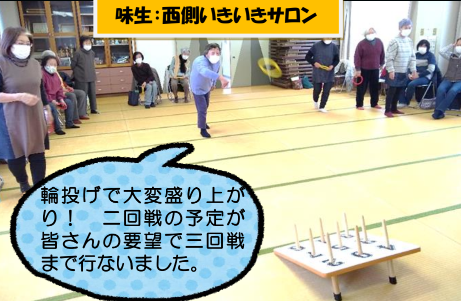
味生:西側いきいきサロン