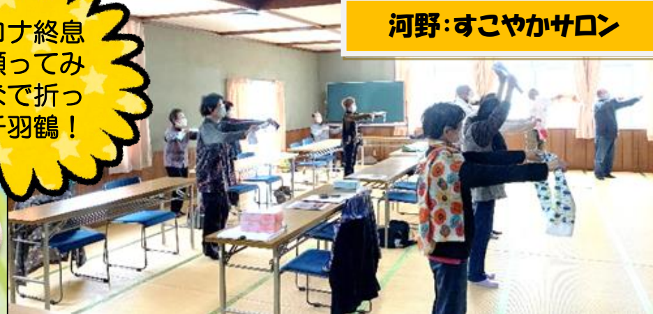
河野:すこやかサロン