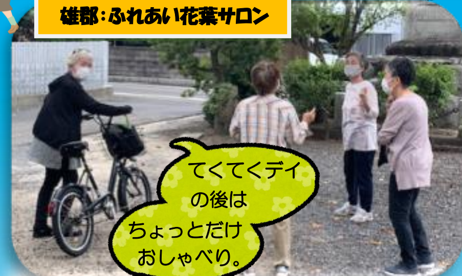
雄郡:ふれあい花葉サロン