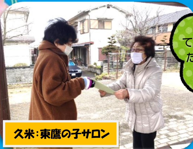
久米:東鷹の子サロン