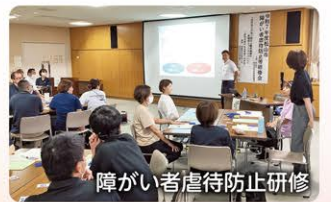
障がい者虐待防止研修

住民が必要なときに必要なサービスの情報を得て、適切に利用できるよう住民ニーズの把握と情報発信を行います。また、サービスの提供者が、地域社会の一員として、積極的に地域づくりに参画できるような環境整備に努めるとともに生活課題・福祉課題の解決に向けたサービスの質の向上に取り組みます。