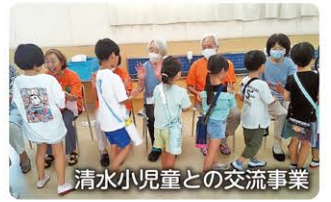
清水小児童との交流事業

人と人、人と地域資源が、世代や分野を超えて出会い、つながりあい、誰もが気軽に参加・活躍できる機会や仕組みをつくることともに、住民一人ひとりが主役となり、主体的・積極的にに関わり、輝くことができる環境づくりに取り組みます。