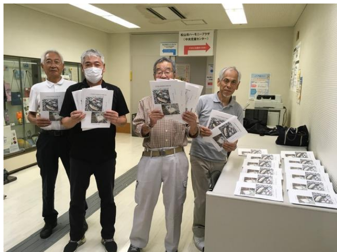
役員で印刷製本をしました