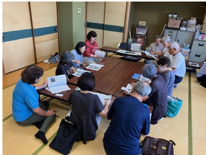
策定委員会の様子

久枝地区社会福祉協議会が策定した「第2期久枝地区地域福祉活動計画」が完成しました！