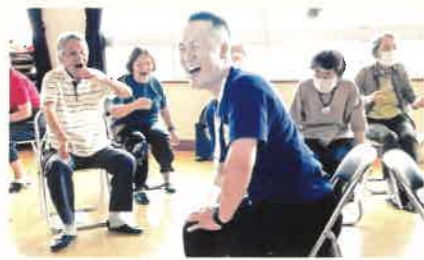
ふれあいサロン『泉まち』