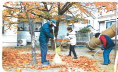
ふれあいサロン竹原