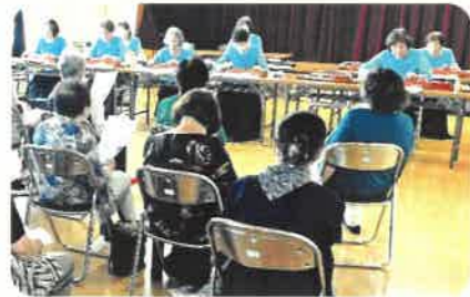
ふれあい・いきいきサロン『雄郡』