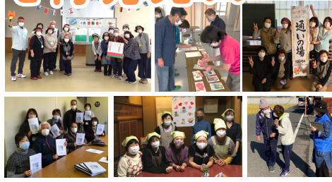
写真はこれまでに開催したお宝発表会の事例です